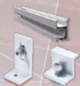
Estructuras para instalación